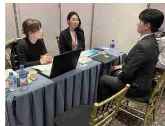
令和5年度 モンゴル就職面接会 面接風景