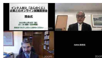
令和5年度 インド就職面接会(オンライン)開会式